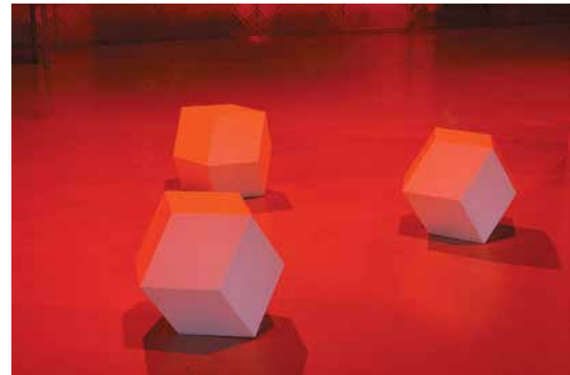
La Gaité lyrique, Paris